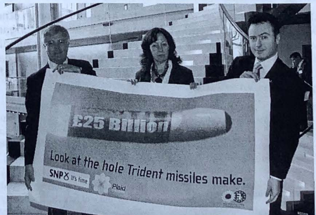
ASEau SNP a Plaid Cymru yn datgelu poster yn Senedd Ewrop yn Strasbwrg (14 Mawrth) fel rhan o'r ymgyrch yn erbyn adnewyddu rhaglen arfau niwclear Trident y Deyrnas Gyfunol. Yn y llun o'r chwith i'r de fe welir Ian Hudghton (SNP), Jill Evans (Plaid Cymru) ac Alyn Smith (SNP).